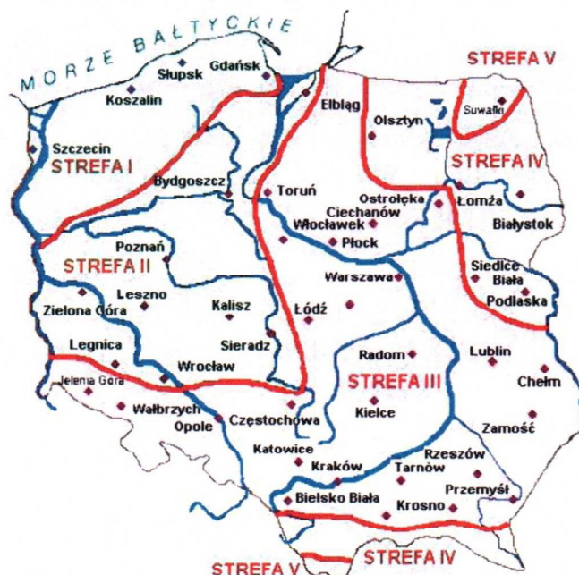
Rys. 1 Strefy klimatyczne Polski i temperatury obliczeniowe

Położenie obiektu, w którym planowany jest montaż, na mapie ma wpływ na pracę instalacji oraz na dobór mocy projektowanego kotła. W zależności od współrzędnych geograficznych rozbieżności w temperaturach projektowych mogą mieć znaczącą wartość i wpływ na zapotrzebowane na ciepło w budynku. W skali kraju ilustruje to poniższa mapa (Rys.1).